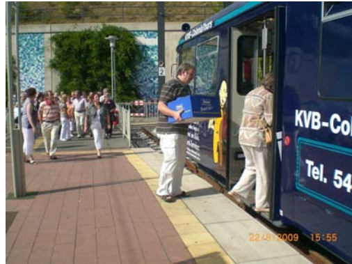
..... Die Verpflegung muss mit hinein