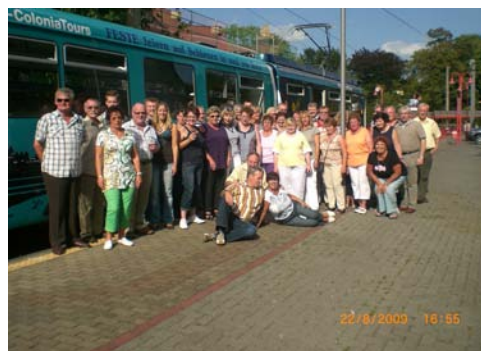
Die Helfer vor dem Colonia-Express