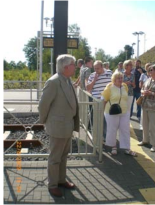
Der Präsident begrüßt die Truppe