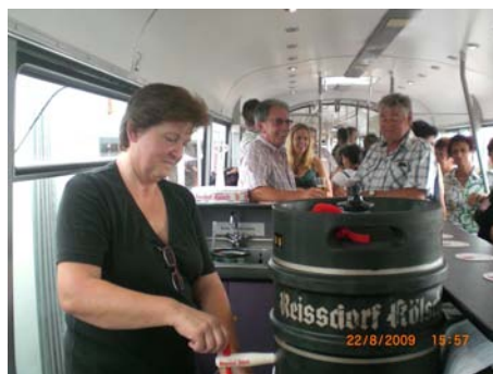
Die Versorgung in der Bahn klappte